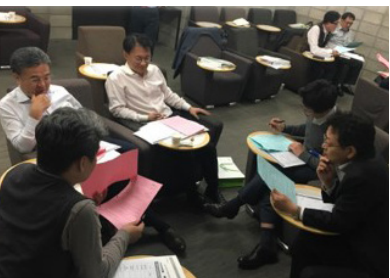
의사결정자가 느끼는협상의 어려움 토론