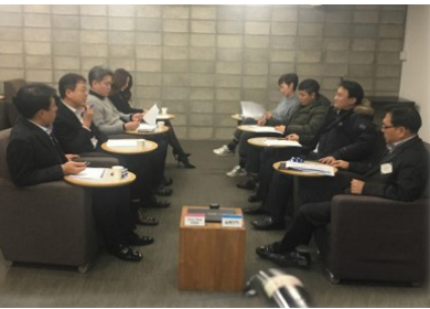
Real 협상진행 및 전문교수진의 코칭