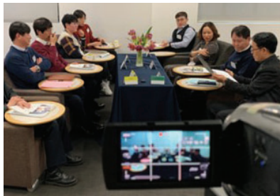
Real 협상진행 및 전문교수진의 코칭